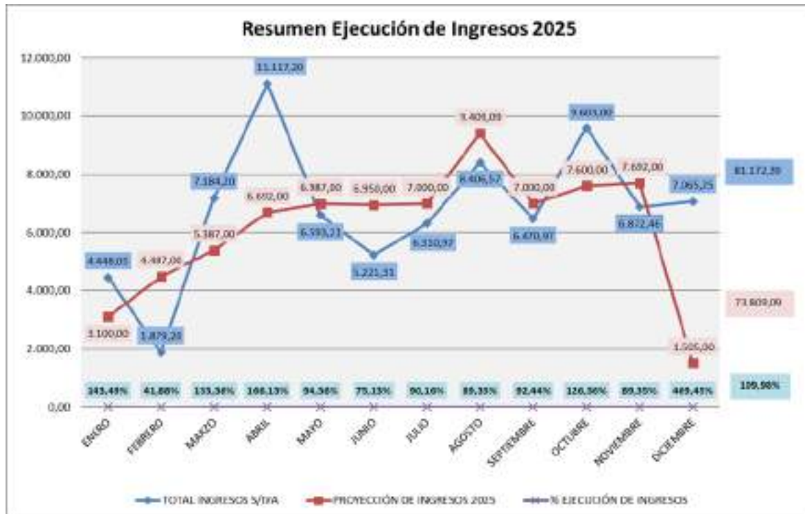
Figura 1. Resumen mensual de ejecución de ingresos del año 2025.